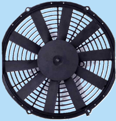
280mm 有刷轴流风机 12V DC 280mm Brushed Axial Fan