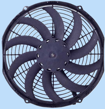
305mm 有刷轴流风机 12V DC 305mm Brushed Axial Fan